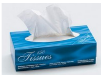
Plusieurs boîtes de mouchoirs, des lingettes et un rouleau de petit sac poubelle (pour salle de bain)