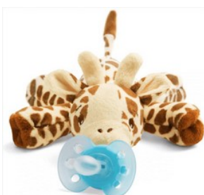
Une tétine (seulement si besoin) pour les PS et un doudou