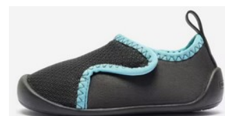
Chaussons pour la classe et la gym