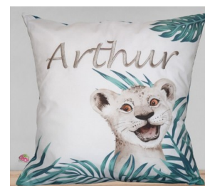
Un coussin pour les MS et les GS pour le temps calme