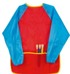
Tablier pour la peinture