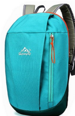
Change complet : culotte, chaussettes, tee-shirt, pantalon/legging, pull dans un sac à dos