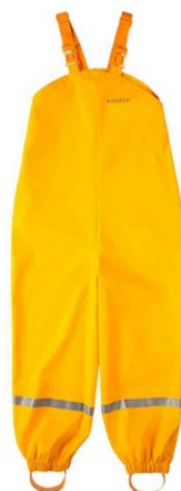
Une tenue : salopette imperméable pour faire classe dehors