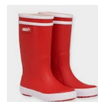
Une paire de bottes