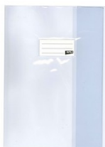
Protège cahier 24x32 transparent incolore pour les PS

Vous pouvez dès à présent prévoir pour votre enfant les fournitures de rentrée indiquées ci-dessous.