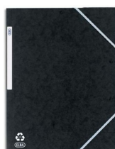
Une chemise noire à élastique pour mettre les livrets scolaires