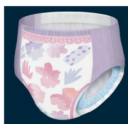
Pour les PS, couche culotte sans scratches